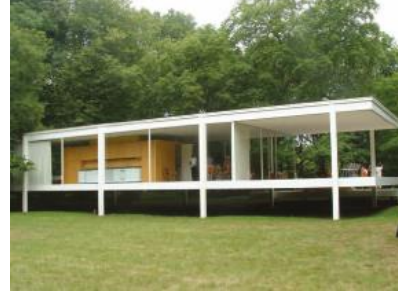
الشكل (3) منزل فارنسورث في بلاتو، إلينوي، ميس فان دير روه، 1946م.