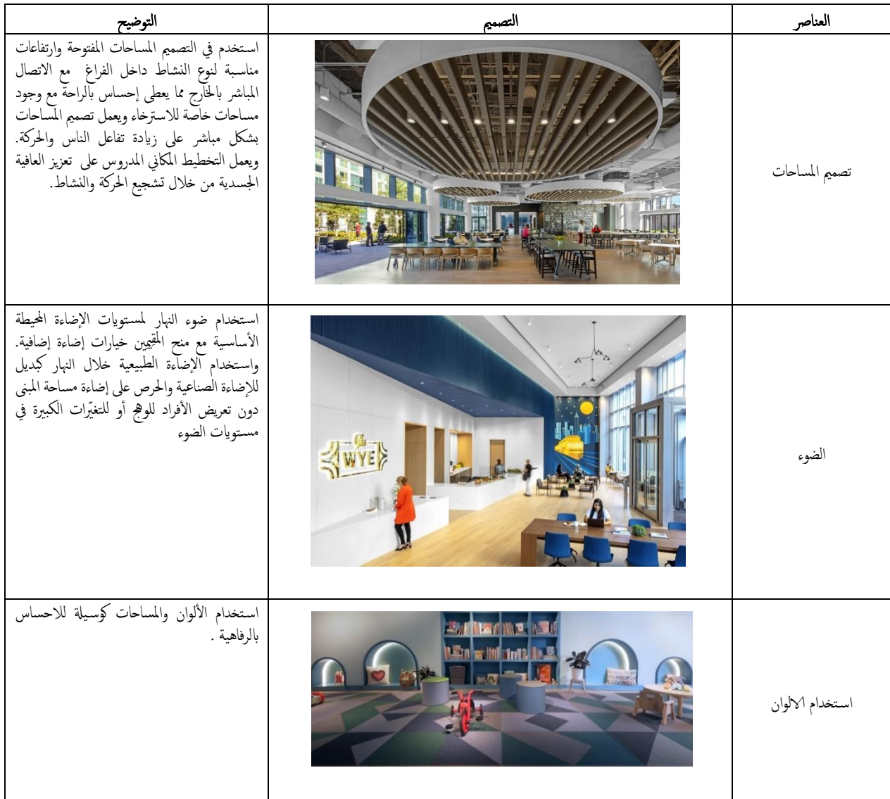
جدول (9) عناصر التصميم لمبنى نورفولك للوصول إلى الصحة والرفاهية