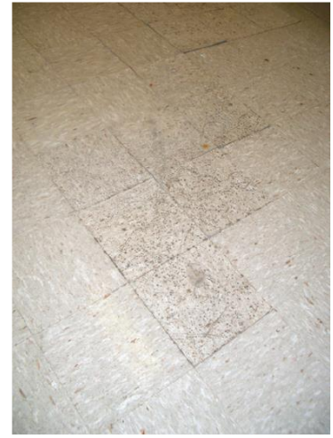
الشكل (4) ظهور العفن على أسطح الداخلية للمباني والارضيات نتيجة لزيادة الرطوبة.