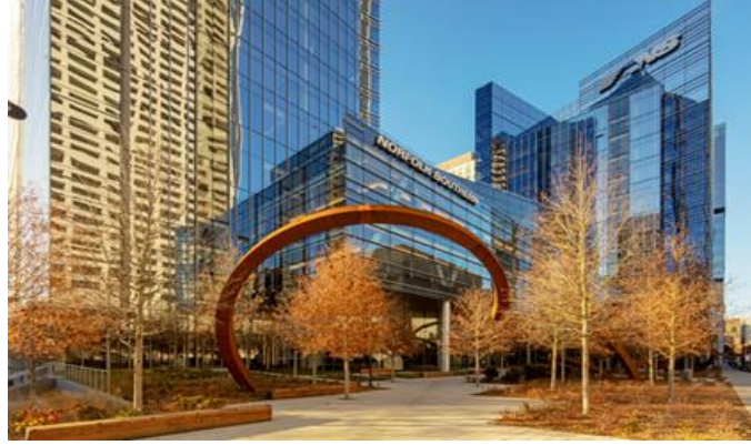
الشكل (5) مقر نورفولك الجنوبي - أتلانتا

من خلال التغلب على هذه التحديات، يمكن للعمارة أن تلعب دورًا حاسمًا في تعزيز الصحة والرفاهية وتحسين جودة حياة الناس في المجتمعات المعاصرة. وهناك عدد من المشاريع التي تعمل للوصول إلى الصحة والرفاهية في المباني من خلال التصميم ويوضح الشكل (5) مبنى مقر نورفولك الجنوبي- أتلانتا وهو حاصل على شهادة (LEED Gold) والجوائز (USGBC) جورجيا وجائزة كريساليس للبناء والتشييد (IIDA) لأفضل مشروع مؤسسي بمساحة تزيد عن 75,000 قدم مربع. وهو تصميم مستدام يراعى الصحة والرفاهية في التصميم ويحقق هذا الهدف من خلال مبنى يؤكد على الاختيار والتعاون والابتكار في التصميم للوصول إلى الصحة والرفاهية. يضم المقر الرئيسي 3000 عضو من فرق العمليات والتكنولوجيا وفرق الشركة [32]، ويقدم للموظفين خيارات متنوعة لأماكن العمل ووسائل الراحة. ويوضح جدول (9) عناصر التصميم لمبنى نورفولك للوصول إلى الصحة والرفاهية.