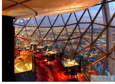
الشكل (2) استخدام الألوان والمساحات كوسيلة للإحساس بالرفاهية.